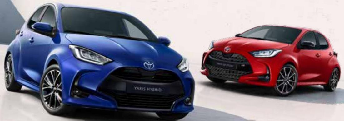
Yaris – udvalg af enkeltfarver