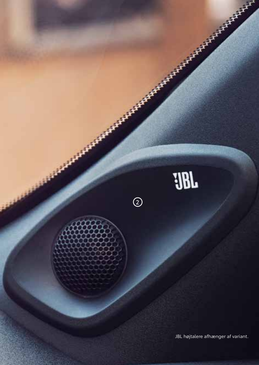
JBL højtalere afhænger af variant.